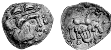
Chichester Lyre silver unit, 15mm, 1.30g. Locally engraved version of Sussex Lyre, c.55-40 BC. Both prototypes for the Andover punch.

This would explain why it is off-centre: if it was cast the genuine coin used to create the mould may well have been off-centre and if struck it would have been a simple error in positioning the die. It is important to note that the small crack on the barrel of the piece and the slight widening at the base can not only be used as evidence that it was used to strike impressions, but may equally indicate that the impression (though not the drum itself) was struck rather than cast. If the latter is the case an old die may have been ground down at both ends to receive an impression, from which it follows that the signs of stress on the shaft may be, at least in part, the result of this earlier use. The faint hint of a filed projection, possibly a spike used to anchor a die in to a wooden anvil base, is visible on the base, although it is just as likely to be a casting flaw. Until a genuine or plated coin with the precise bust of the Andover object appears it is difficult to narrow down the above options and the possibility that an apprentice piece is attractive; on balance, however, I would slightly favour its being a punch used to create forgers' dies."