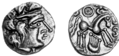
Sussex Lyre silver unit, 13mm, 1.29g. One of the first silver coins made in Britain, c.55-40 BC. Engraved by Gaulish die cutter?

the dies for the noticeably crude Chichester Lyre silver, and is also consistent with the typologically early bust. Another option is that it is a punch used for hubbing obverse dies before they were touched up by hand. The great difficulty with this is that the bust is badly off-centre; a punch to make genuine dies ought to be well-centred, as is the Pegasus punch from Manching. Using this piece as a punch would create a rim immediately in front of the face on the die, which would have to be ground down before the motifs in front of the face and the rest of the beaded border were added. This is unlikely in the context of an official mint and opens up the possibility that it is a punch made from a cast impression of a genuine coin, or struck from a genuine die, which was then used to make a die or dies for producing plated forgeries.